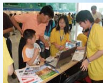
iCAN'11世界大会 展示風景

世界大会 http://www.youtube.com/watch?v=-ol_xB8tc0k