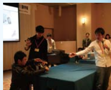
iCAN'11国内予選 発表風景